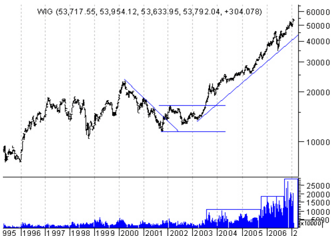
Wykres 3. Indeks WIG z zaznaczonym wolumenem

Obserwacja wolumenu nie może być traktowana jako samodzielny wskaźnik. Jest to raczej wskazówka lub element potwierdzający sygnały płynące z innych narzędzi.