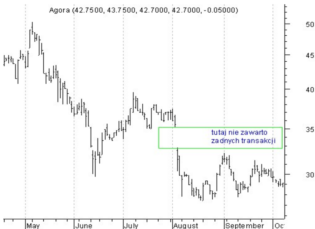
Wykres 2. Kurs akcji spółki AGORA Maj-Wrzesień 2006

Pojęcie ceny nominalnej i emisyjnej oraz zależności między nimi omówimy szerzej przy okazji emisji pierwotnej akcji. Teraz natomiast zastanówmy się czym jest cena rynkowa .